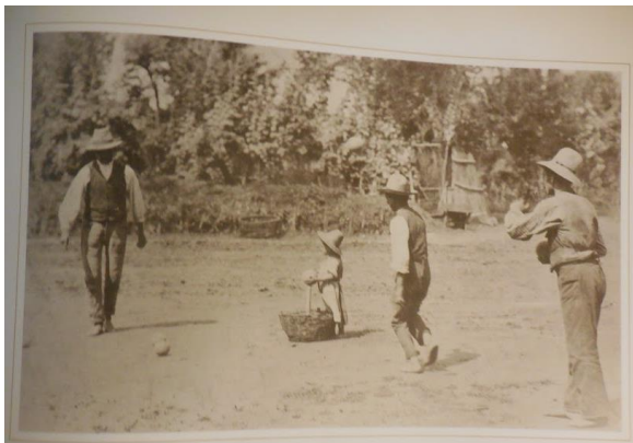
▪ Gioco delle bocce(1887-90)