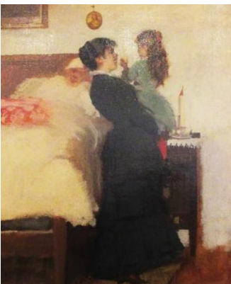
Piccoli pittori(Quadreria civica Comune di Noale)

Sul comodino c'è la candela , per fare luce la sera. Noi abbiamo la lampada .