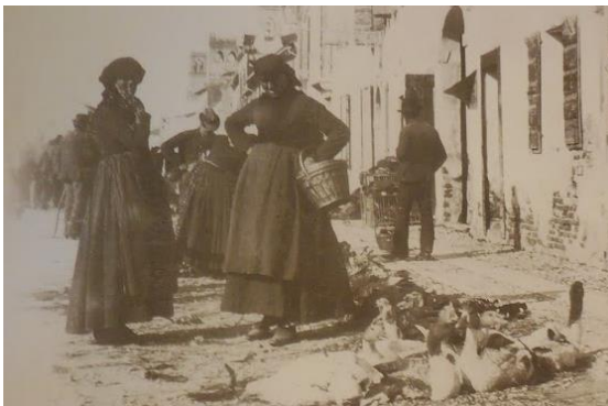
Mercato delle oche a Borgo Mestre (1887-90 )