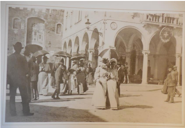
Passeggio festivo (1887-90)