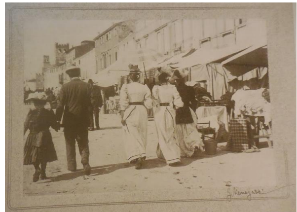
Quattro passi al mercato di Noale (1887-90)