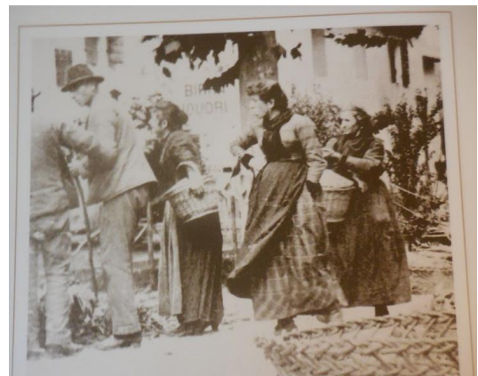
Mercato della verdura davanti alla trattoria "Ai morari"