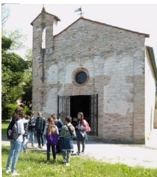
Chiesa di S. Maria di Rossignago