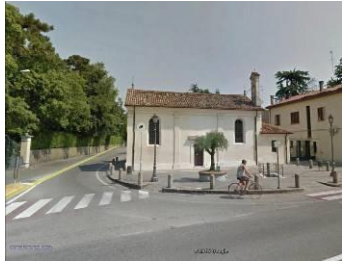
Oratorio s. Leonardo