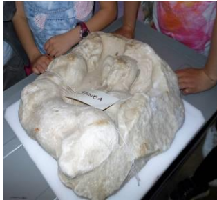
Il pezzo di sarcofago