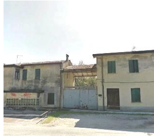
Lo scopificio Salvato