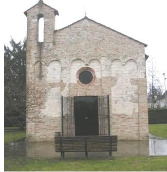
Oratorio S. Maria Assunta