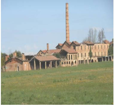
La fornace Cavasin