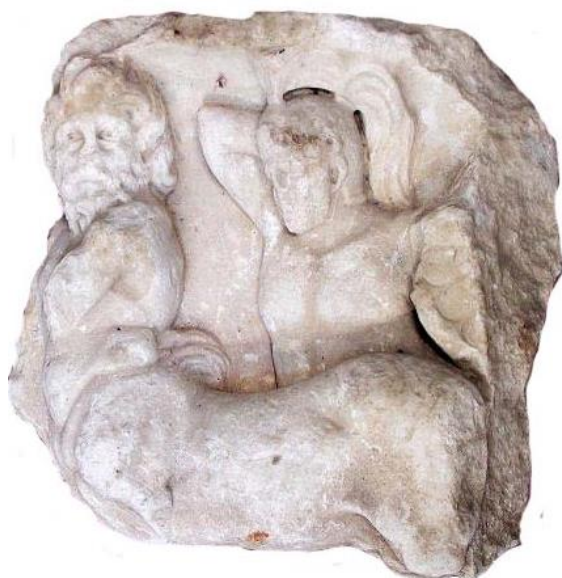
Frammento di sarcofago del II – III secolo dopo Cristo, di produzione locale