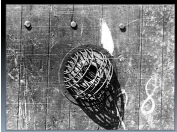
1. La griglia emisferica che protegge lo spioncino sul lato interno di una porta a tenuta di gas trovata nel 1945 in ARCHIVIO Auschwitz-Birkenau.